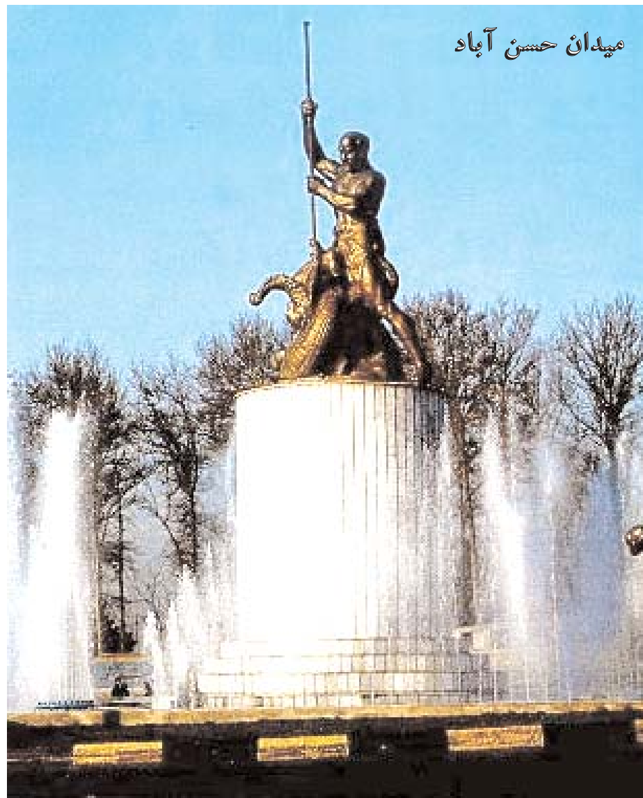
میدان حسن آباد

گودار شخصا ضمن پاره ای حفاریها و تحقیق و پژوهش در نقاط مختلف ایران ، دولت را نسبت به اهمیت میراث فرهنگی ایران و ضرورت جمع آوری و حفظ آثار گذشته در یک موزه آگاه و حساس ساخت. او بنیان گذار موزه ایران باستان و در عین حال طراح و معمار ساختمان زیبای این موزه بود که از سبک کاخ تیسفون الهام گرفته بود.